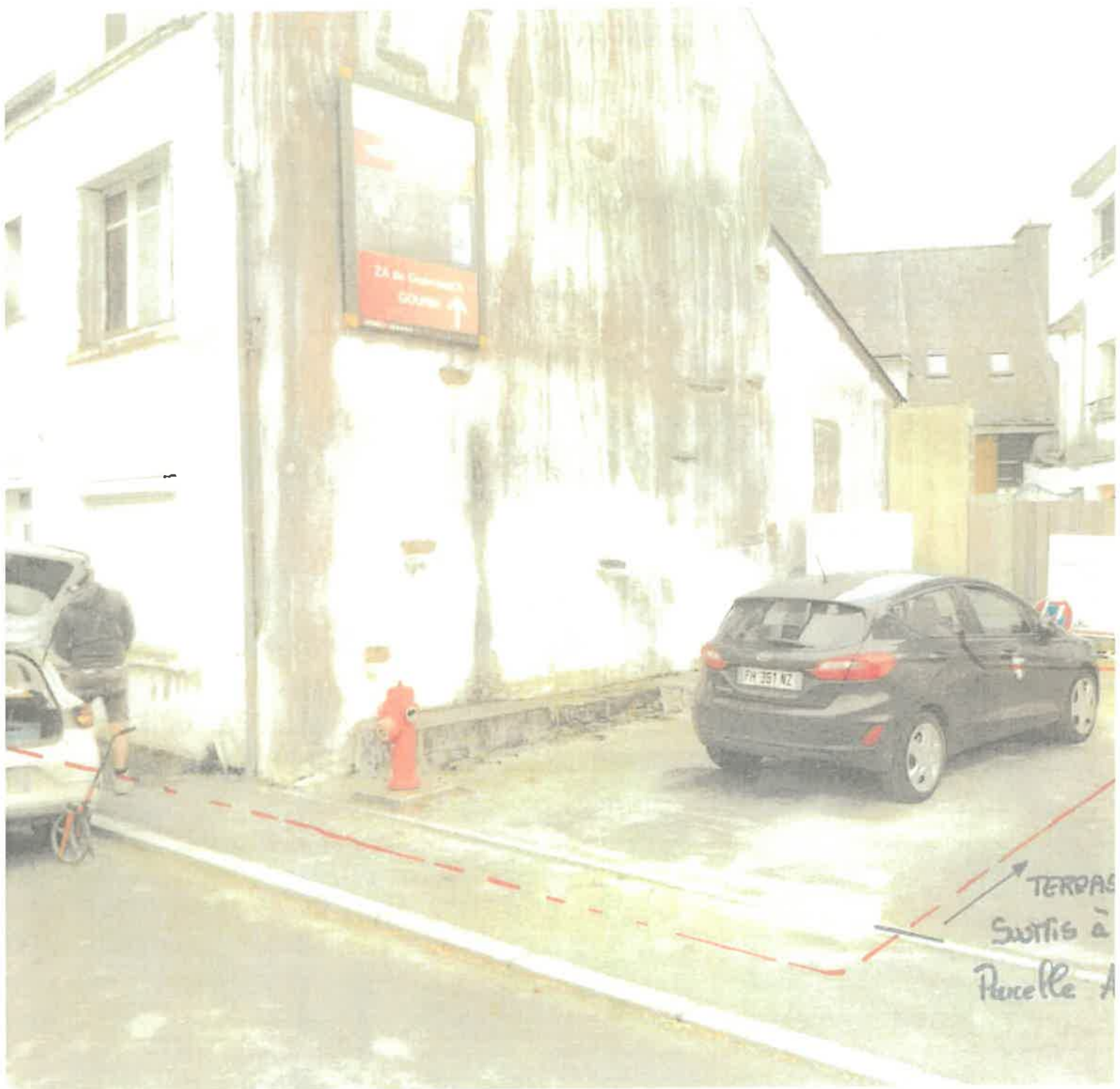
2 - RUE DE CARTHAI